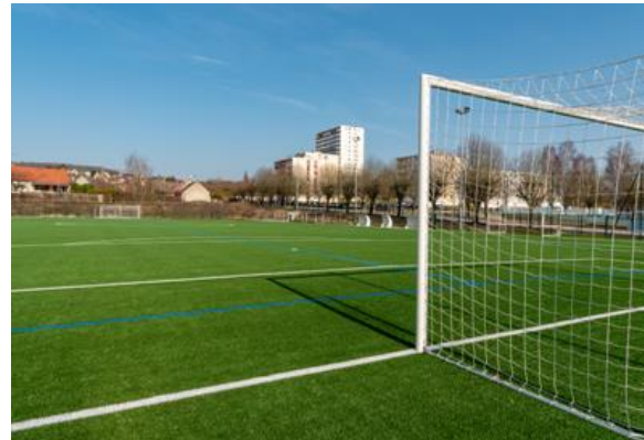
Terrain synthétique réalisé par la Ville de Joigny :