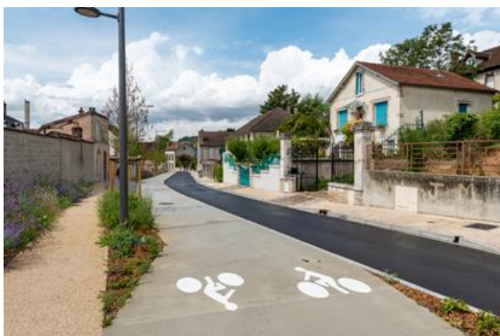
Liaison douce entre le centre ancien et la Place Colette réalisée par la Ville de Joigny :