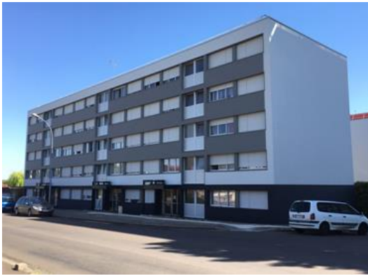
Bâtiment requalifié par la Simad :